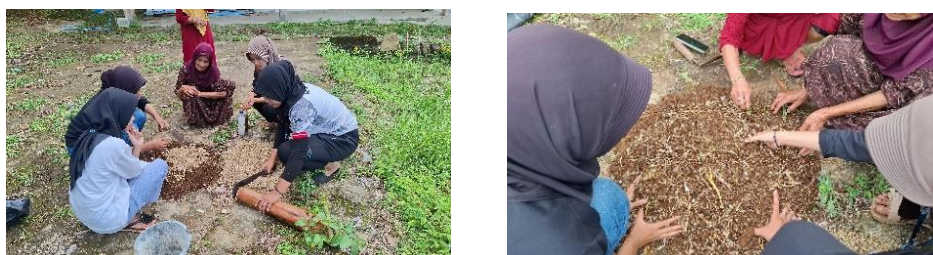
Gambar 2. Pelaksanaan kegiatan sosialisasi